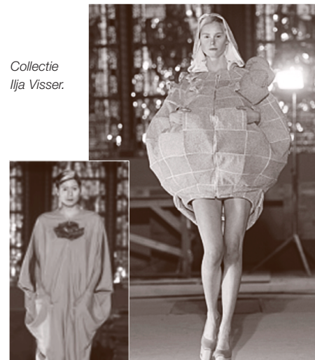
Collectie Ilja Visser.

Het Rijksmuseum, nog volop in restauratie, was op 13 januari voor één middag het decor van een catwalk. De modellen toonden in de Eregalerij van het museum de nieuwste collectie van modeontwerpster Ilja Visser. Zij liet zich voor haar creaties inspireren door niemand