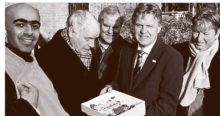
CDA delegatie overhandigt de taart

Het CDA Amstelveen heeft maandag 21 februari j.l. in het kader van de campagne voor de Provinciale Staten verkiezingen speciaal